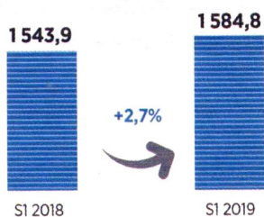
Résultat d'exploitation M MAD