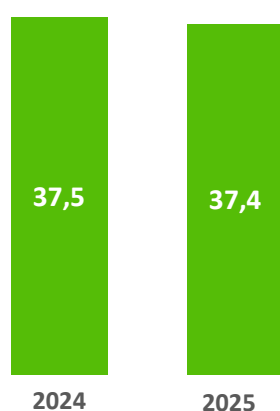
■ Chiffres d'Affaires