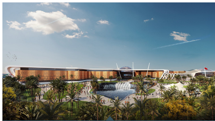
EXTENSION AÉROPORT MARRAKECH MENARA