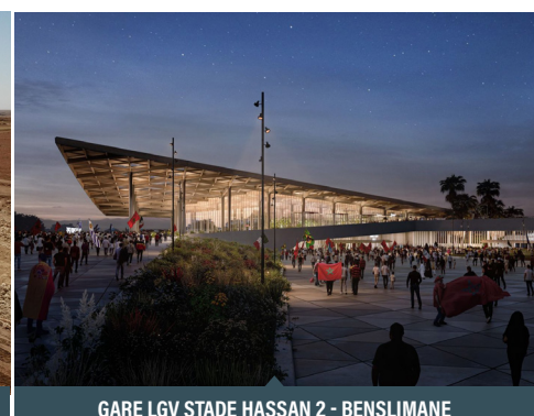
GARE LGV STADE HASSAN 2 - BENSLIMANE