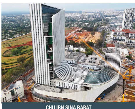
CHU IBN SINA RABAT