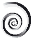
TABLEAU DES CREANCES