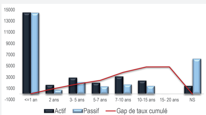
IMPASSES ANNUELLES DE TAUX

L'impact des scénarii réglementaires est de 4,50% sur la marge d'intérêt nette prévisionnelle et de 13,64% sur la valeur économique des fonds propres.