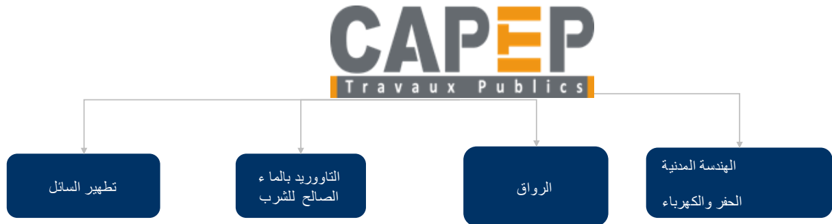
الشكل 1 : أنشطة كابيب إلى غاية نهاية السنة المالية 2011