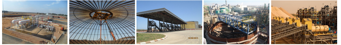
Tableau des Amortissements