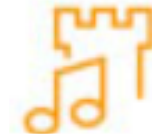
Dialogue des cultures et patrimoine