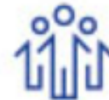
Education et insertion des jeunes