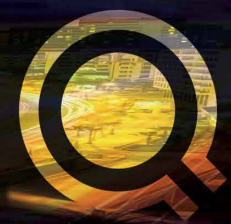
TABLEAU DE FINANCEMENT DE L'EXERCICE